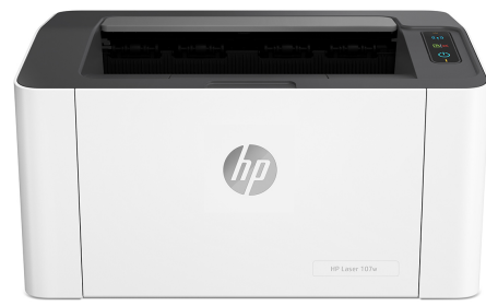
Impresora HP Laser 107w

Impresora con seguridad dinámica habilitada. Para uso exclusivo con cartuchos que utilicen un chip original de HP. Es posible que no funcionen los cartuchos que no utilicen un chip de HP, y que los que funcionan en la actualidad no funcionen en el futuro. Obtenga más información en: