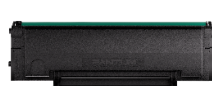
Cartucho de tóner TL-2310H 1600